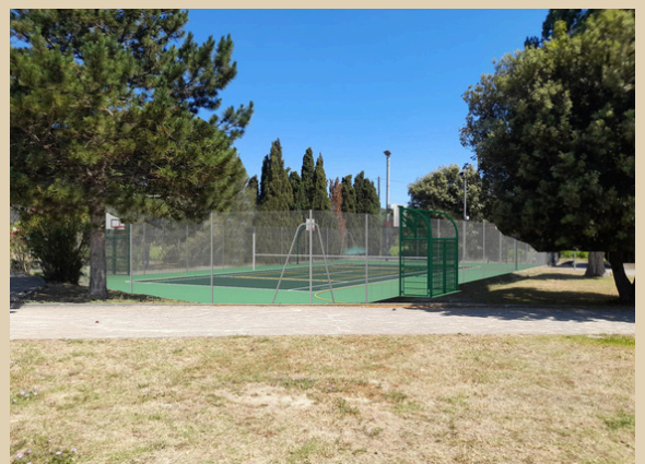
Terrain Multisport - Photo non contractuelle

Le court de tennis communal sera transformé en terrain multisport, permettant la pratique de diverses disciplines et favorisant l'activité physique pour tous les âges. Cet espace convivial et sécurisé sera en libre accès. Les travaux ont débuté fin novembre.